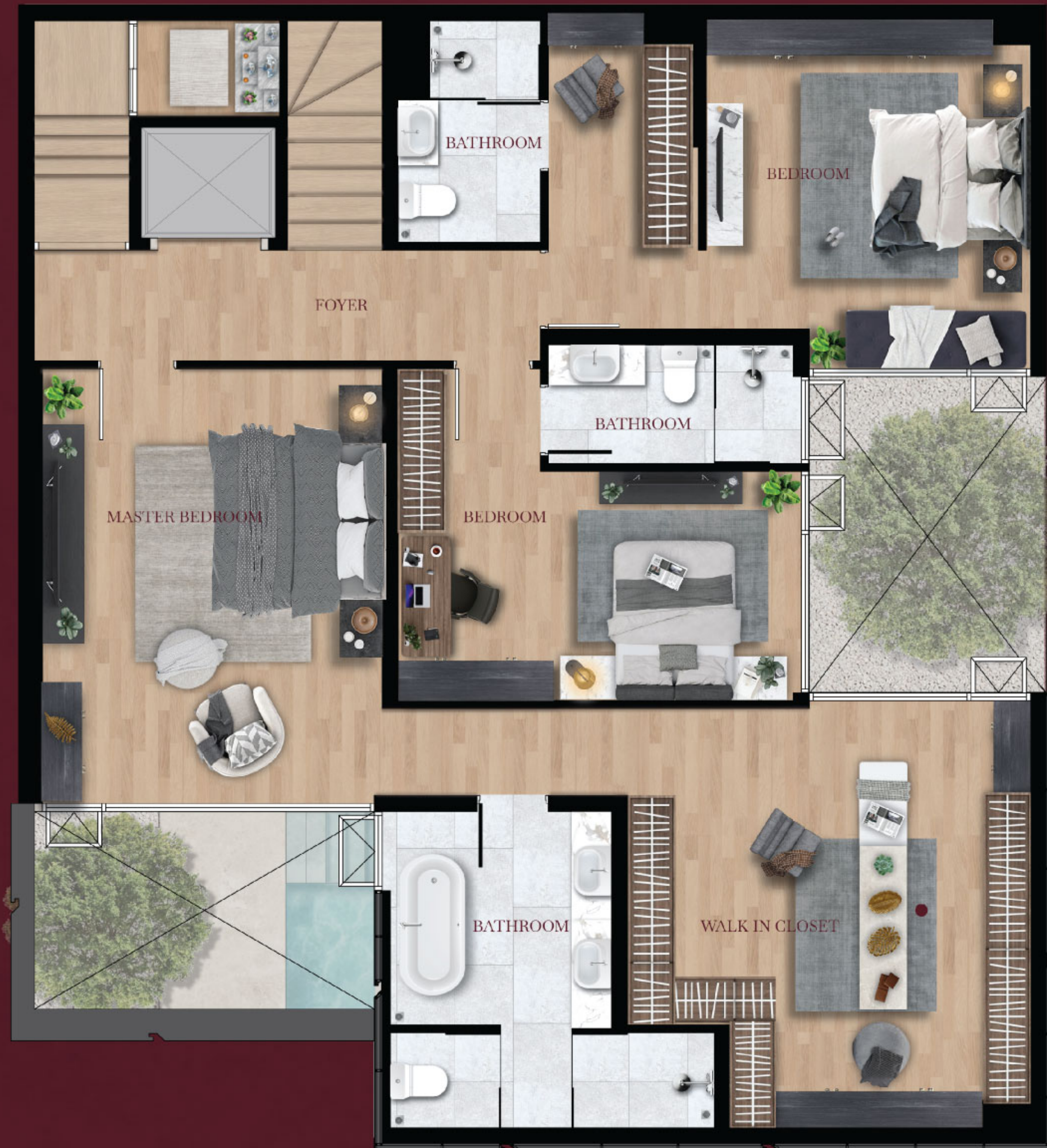
3 rd floor