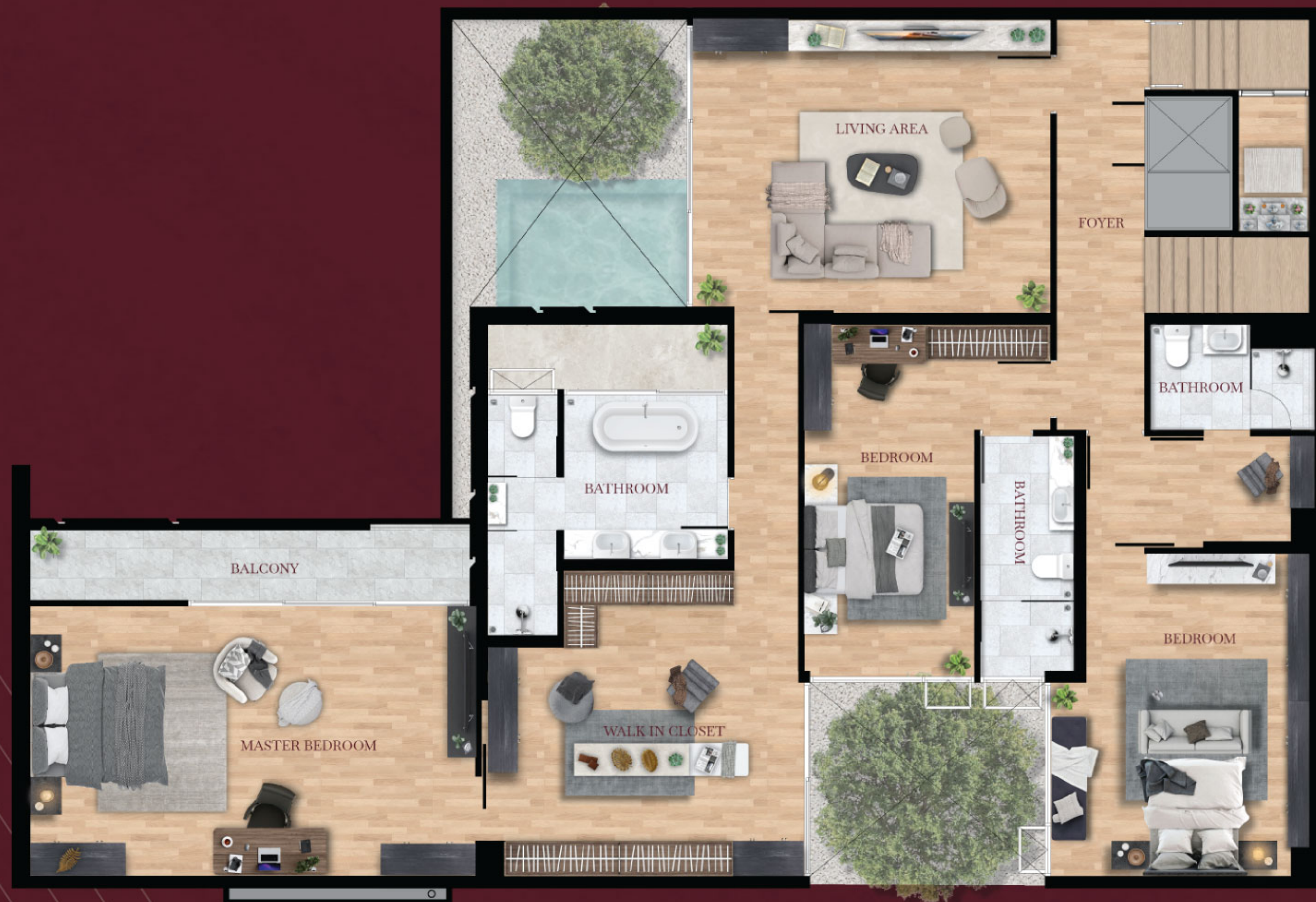
3 rd floor