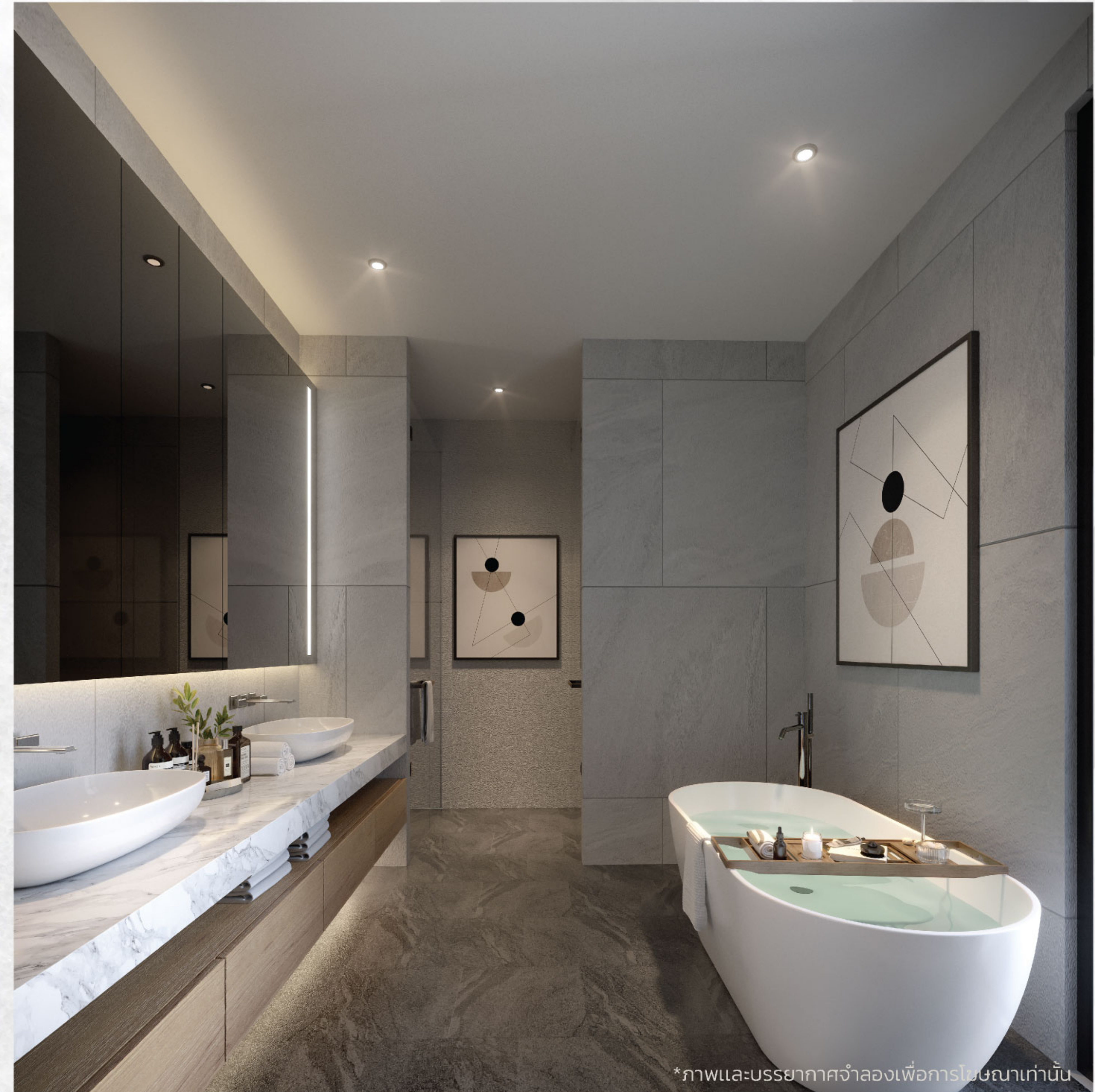
*ภาพและบรรยากาศจำลองเพื่อการโฆษณาเท่านั้น