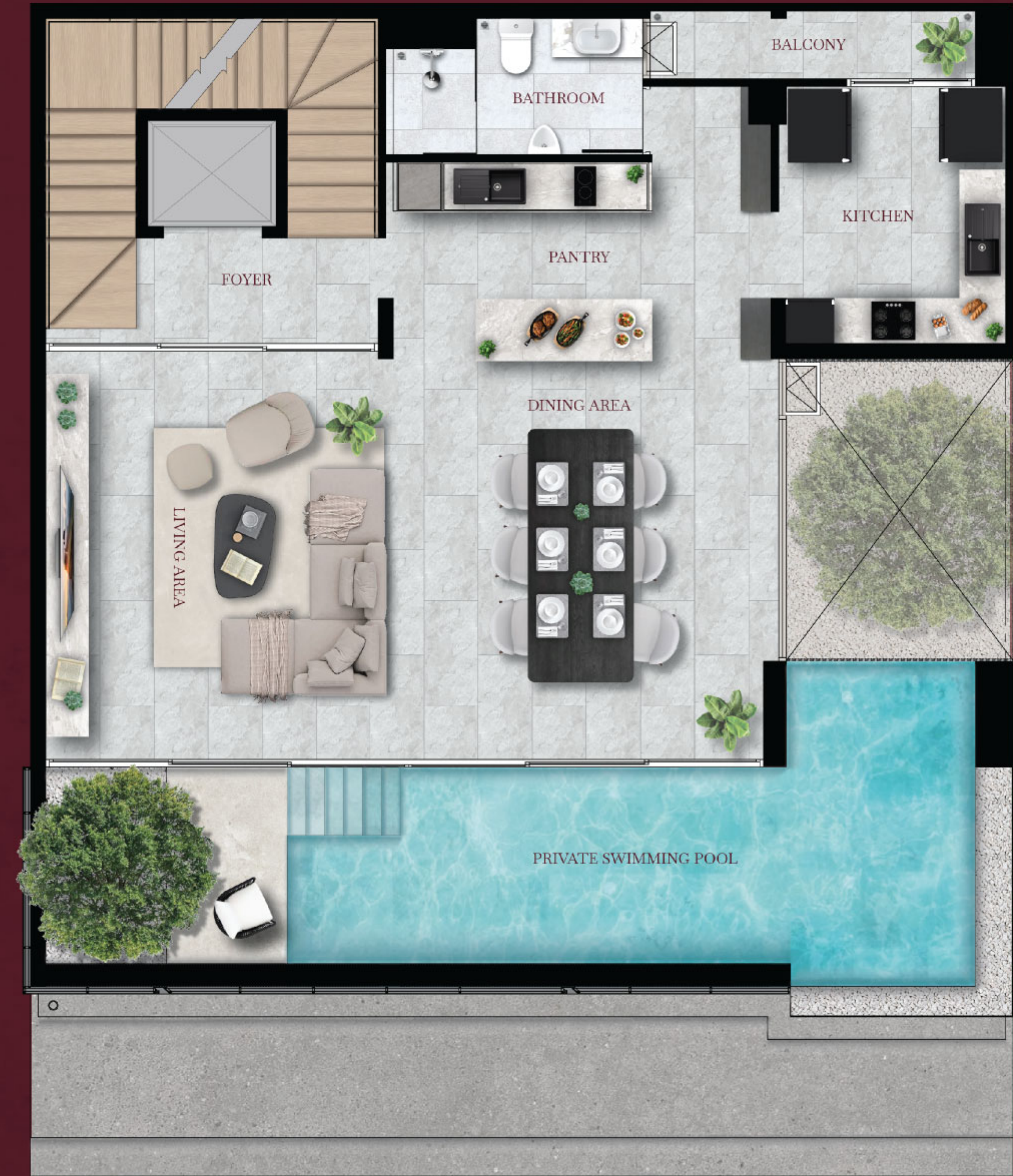
2 nd floor