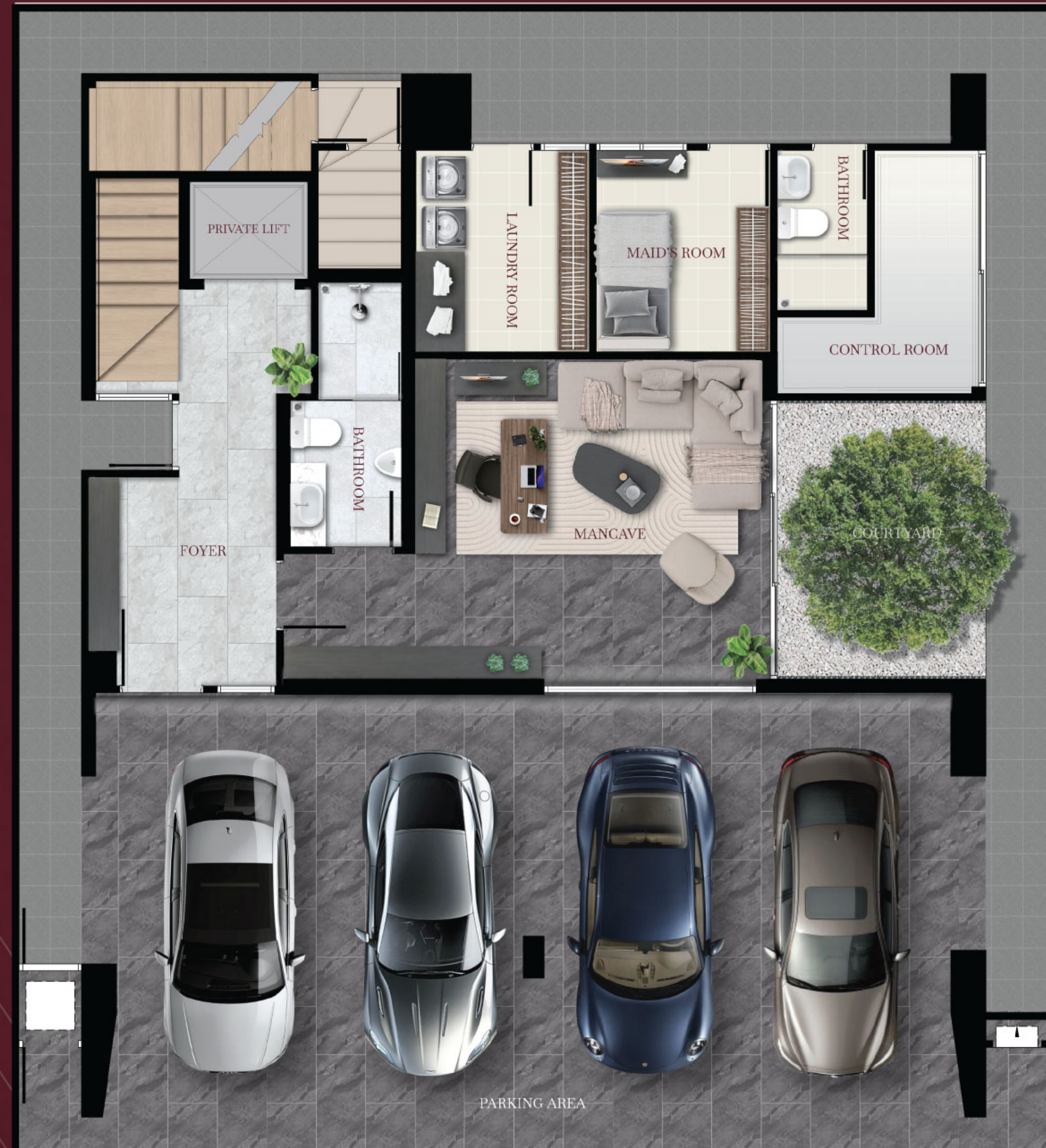
1 st floor