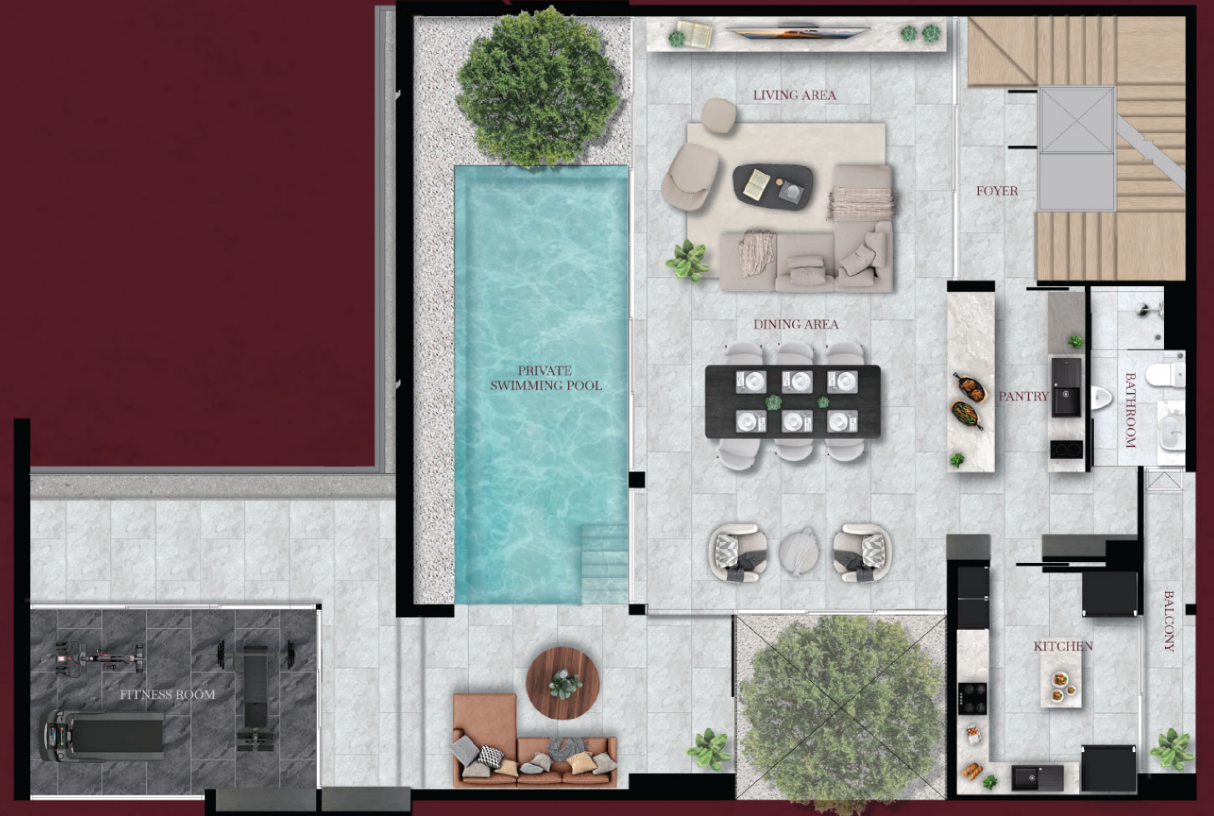
2 nd floor