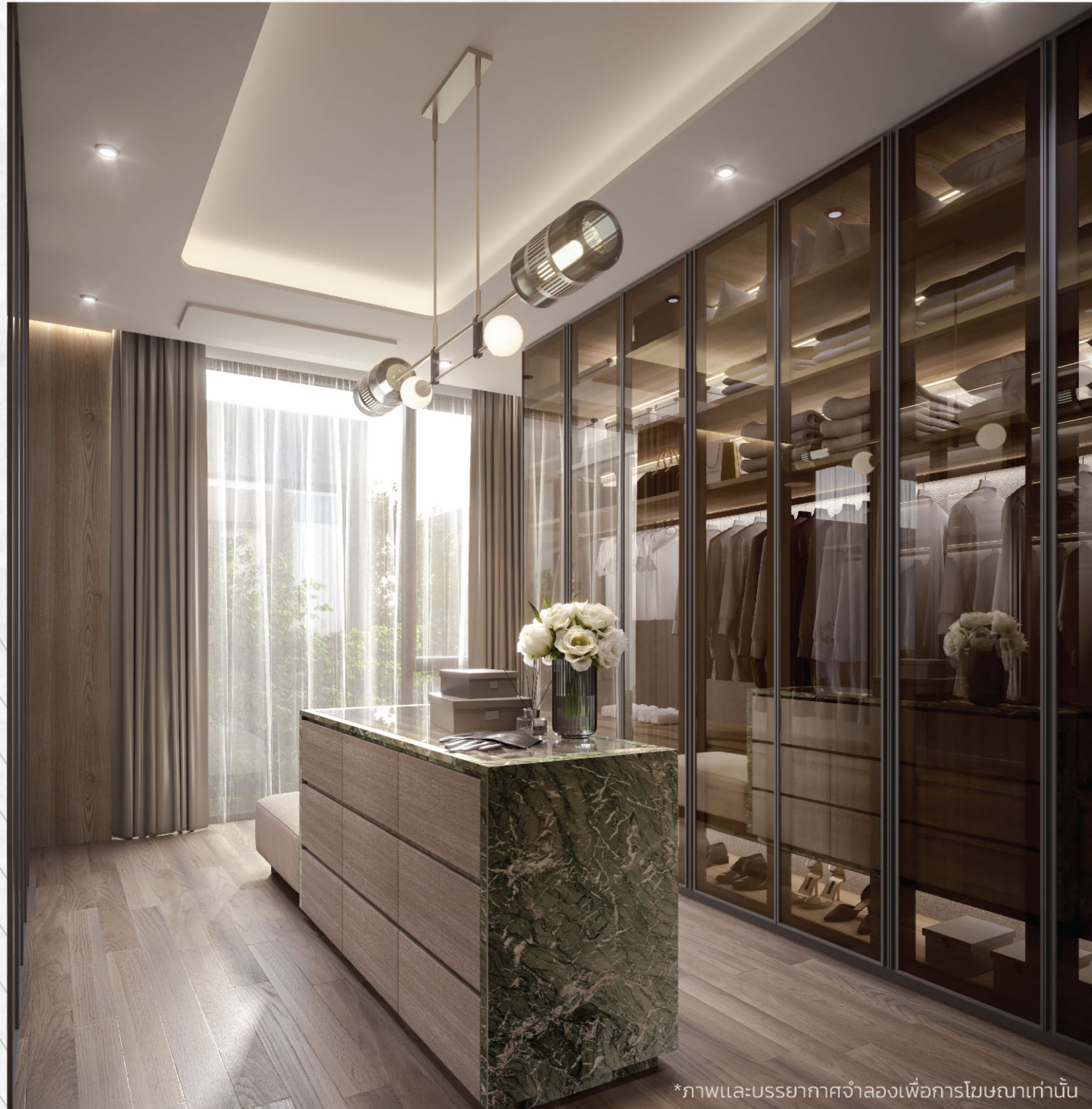
*ภาพและบรรยากาศจำลองเพื่อการโฆษณาเท่านั้น