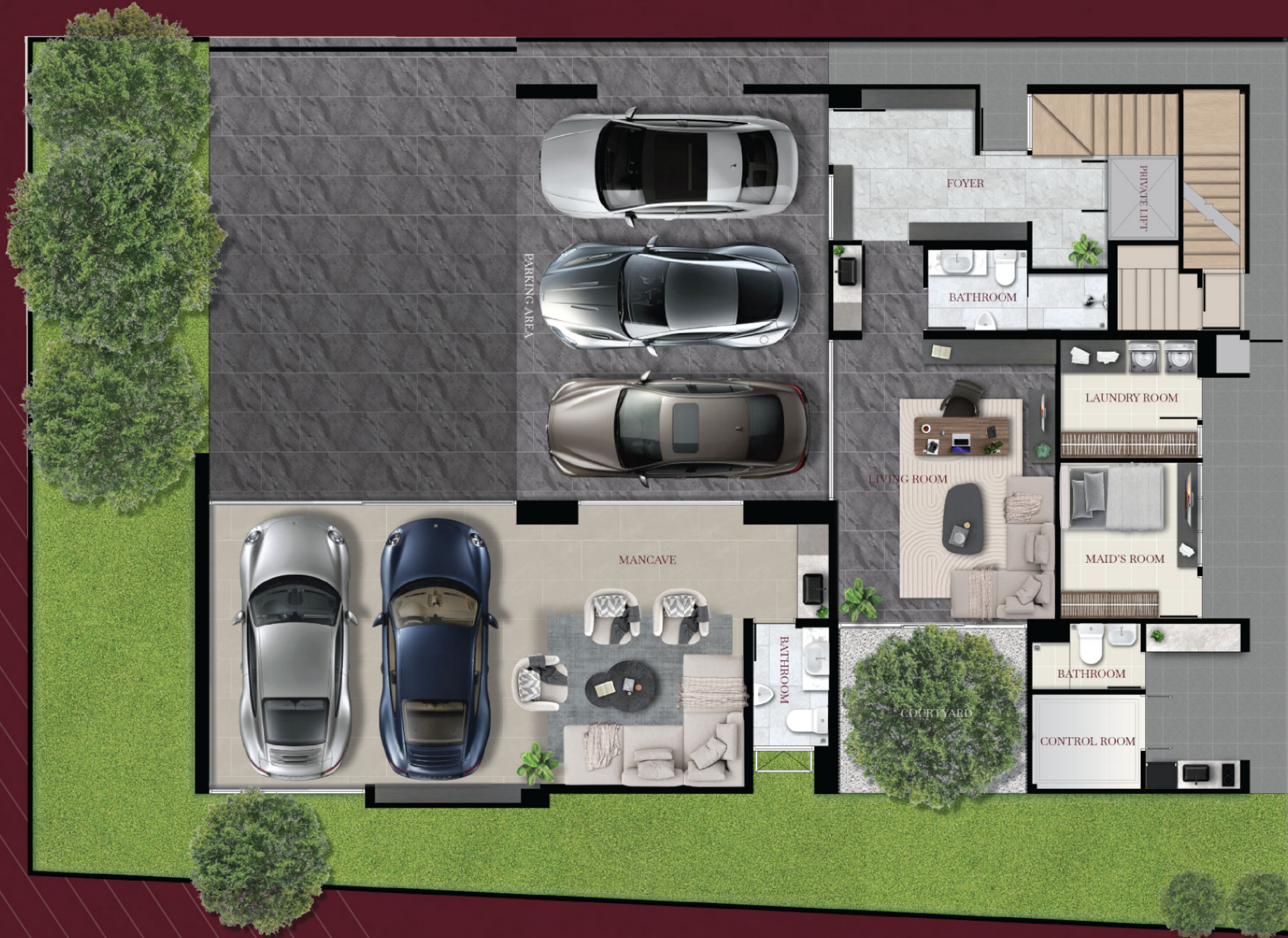
1 st floor